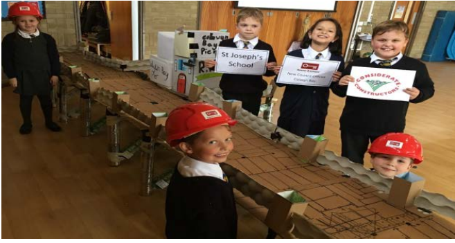
Uchod – Pier arbennig Ysgol Sant Joseph