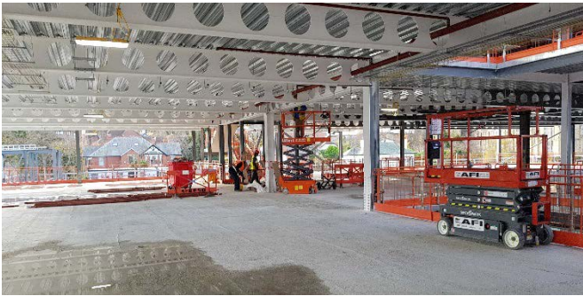
Uchod – golygfa o ochr ddwyreiniol yr ail lawr

Mae uwch staff a Chynghorwyr Conwy hefyd wedi cerdded y lloriau dros y misoedd diwethaf. Mae'r Cyngor hefyd wedi ymestyn allan ac wedi croesawu Bwrdd Ardal Gwella Busnes Bae Colwyn, a bu aelodau o Adeiladu Arbenigrwydd yng Nghymru ar y safle er mwyn deall mwy am Strategaeth Gofod Swyddfa'r Cyngor a'r ffordd mae swyddfeydd Coed Pella'n cael eu cwblhau.