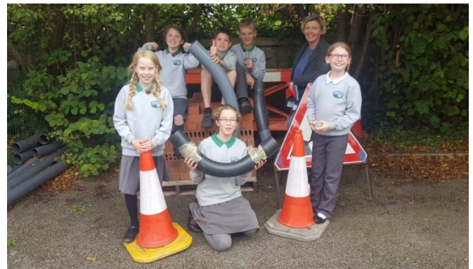
Uchod – Ysgol Llandrillo yn Rhos yn paratoi i adeiladu.

Gan gydweithio ag Ysgol gyfagos Llandrillo yn Rhos, darparodd B&K ddeunyddiau ar gyfer safle adeiladu bychan a greodd yr ysgol er mwyn i’r disgyblion ddysgu mwy am wahanol ddeunyddiau sydd ynghlwm â’r broses o adeiladu a sut gellir eu rhoi at ei gilydd.