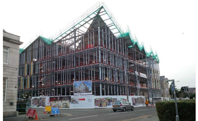
Uchod – gwaith yn parhau ar wedd flaen yr adeilad. Isod – gwaith ar y maes parcio aml lawr.

lloriau uchel ar draws Bae Colwyn a thu hwnt yn anhygoel. Bydd yn adeilad y dylai staff Conwy a Bae Colwyn fod yn falch ohono ac yn esiampl wych o sut gall eiddo fod yn gatalydd ar gyfer adfywio a newid gweithredol".