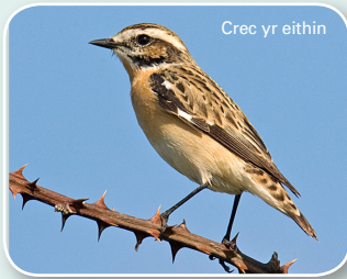
Crec yr eithin

Parhewch i waelod y llwybr a chroeswch y ffordd yn ofalus. Trowch i'r dde a pharhewch i fyny'r bryn ar hyd Marine Drive, a pharhewch i gerdded nes eich bod yn cyrraedd cysgodfa fach gyda seddi.