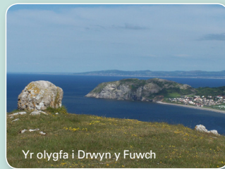
Yr olygfa i Drwyn y Fuwch

Dilynwch y trac heibio maes parcio wedi'i darmacio ar waelod y llethr glaswelltog ar y chwith. Gadewch y trac ger yr arwydd cyfeirio ac ewch i fynyr allt at Arhosfan 9.