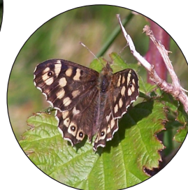
Brych y coed