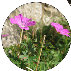
Pig yr aran ruddgoch