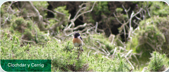
Clochdar y Cerrig

Dechreuwch o'r maes parcio ar y copa. Ewch allan o brif fynedfa'r maes parcio a chroeswch y ffordd, gan gadw'r orsaf dramiau y tu ôl i chi. Byddwch yn gweld postyn cychwyn pren gyda thop melyn yn dangos lle mae'r llwybr natur yn dechrau. Gan gadw'r wal gerrig i'r dde, dilynwch y cyfeirbwynt i'r arhosfan cyntaf.