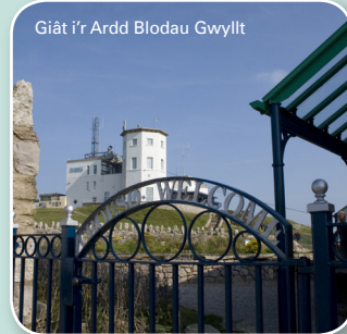
Giât i'r Ardd Blodau Gwyllt

Ewch i fynyr allt heibio i Adeilad y Car Cebel ac ewch heibio i gornel Adeilad y Copa. Ewch tua'r maes parcio, ond cyn i chi gyrraedd ewch trwy'r giât metel ar y chwith i'r ardd flodau gwyllt. Mae arhosfan olaf y llwybr natur yn yr ardd.