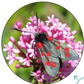
Gwyfyn bwrned chwe smotyn