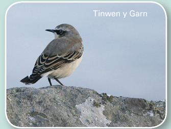
Tinwen y Garn

Ewch heibio'r maes parcio tua'r chwith. Dilynwch yr arwydd cyfeirio i fyny at gornel y wal a throwch i'r chwith yma. Cerddwch ar hyd y wal, gan ei chadw ar y dde, ac anwybyddwch unrhyw lwybrau eraill sy'n arwain i ffwrdd o'r wal. Pan rydych yn cyrraedd cornel nesaf y wal edrychwch ymlaen a thua'r chwith byddwch yn gweld Arhosfan 6.