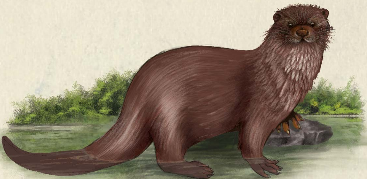
► Dyfyrgi Otter Lutra lutra

There is a lovely picnic and play area and space for wildlife. In fact, it gets a rather elusive visitor - an otter! Unfortunately you are unlikely to see him as he only visits at night.