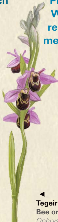
◀ Tegeirian y wenynen Bee orchid Ophrys apifera