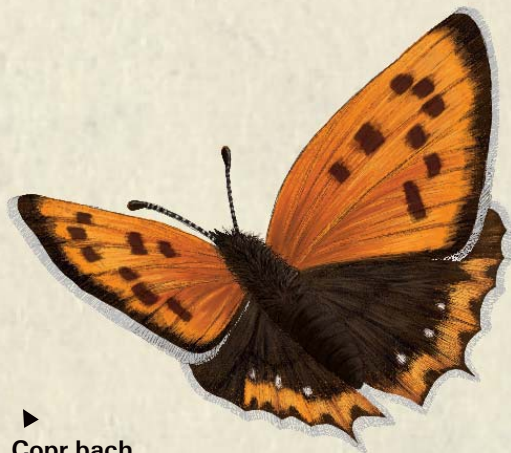
▶ Copr bach Small copper Lycaena phlaeas

For further information on the ideas in this leaflet, please contact Conwy County Borough Council's Parks Section on (01492) 575337 . The Council's Biodiversity Officer would also love to know about any wildlife you have seen visiting Biodiversity Areas; please phone (01492) 575123 .