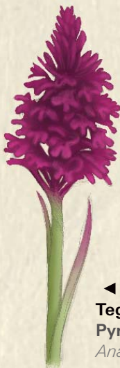
◀ Tegeirian bera Pyramidal orchid Anacamptis pyramidalis

Please check with the North Wales Police Headquarters reception if you wish to visit the meadow.