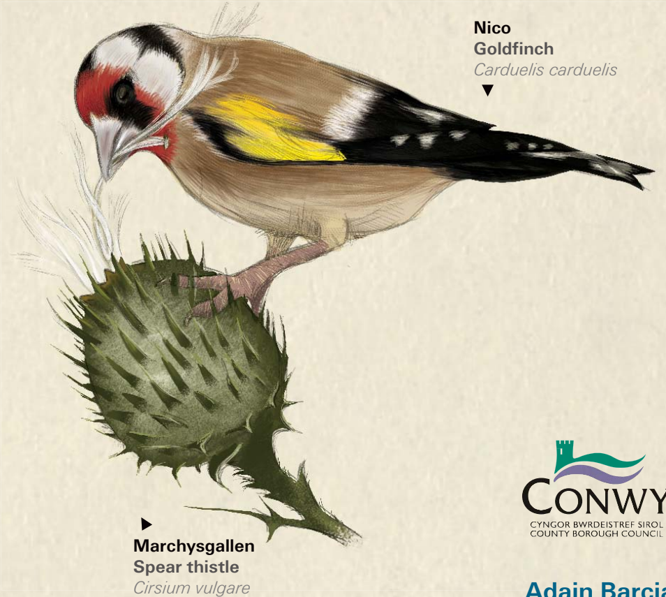
Nico Goldfinch Carduelis carduelis