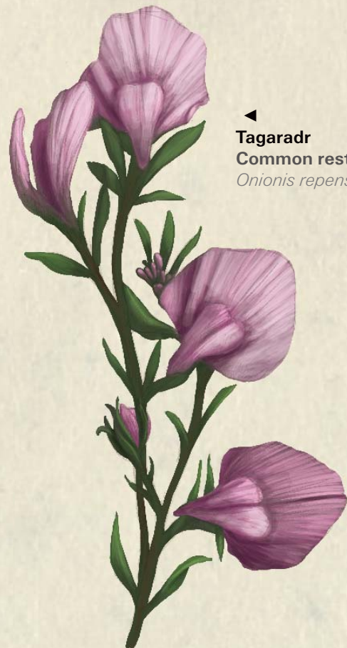
◀ Tagaradr Common restharrow Ononis repens