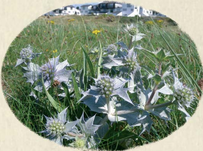
Môr-gelynnen Sea holly Eryngium maritimum

This seaside Biodiversity Area has lots of specialist plants that are adapted to the sandy, salty conditions. The sea holly is a striking misty-blue plant with waxy leaves and spines to help reduce water loss from the leaves. If you look closely you will also find restharrow and common stork's-bill.