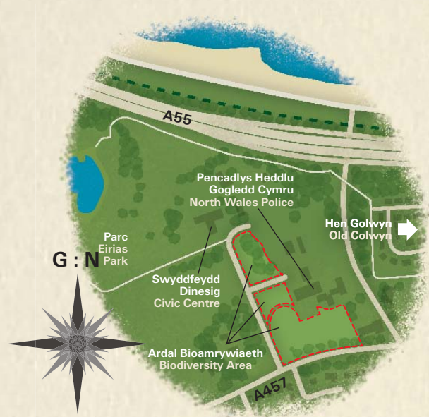
2: Pencadlys Heddlu Gogledd Cymru, Hen Golwyn North Wales Police Headquarters, Old Colwyn