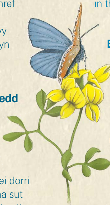
Glesyn cyffredin Common blue Polyommatus icarus

On Biodiversity Areas we leave the grass to grow long in the summer then cut it after the flowers have set seed. This is how meadows were traditionally managed.