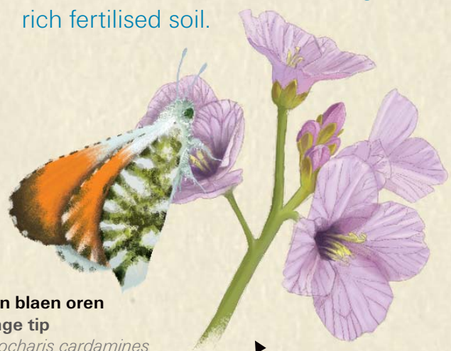
▶ Gwyn blaen oren Orange tip Anthocharis cardamines

We take them away to be composted. If we left them on the site the cuttings would fertilise the soil which would in turn discourage meadow flowers. Most meadow flowers are unable to grow in rich fertilised soil.