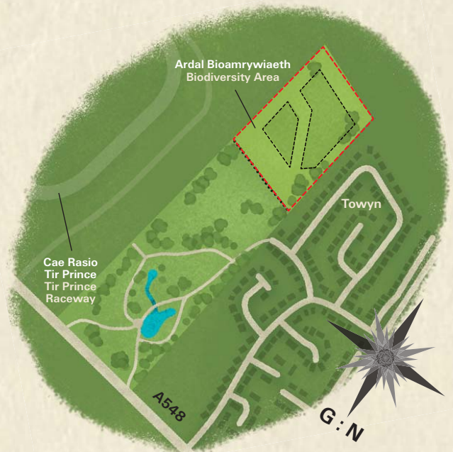
4: Tir Prince, Towyn