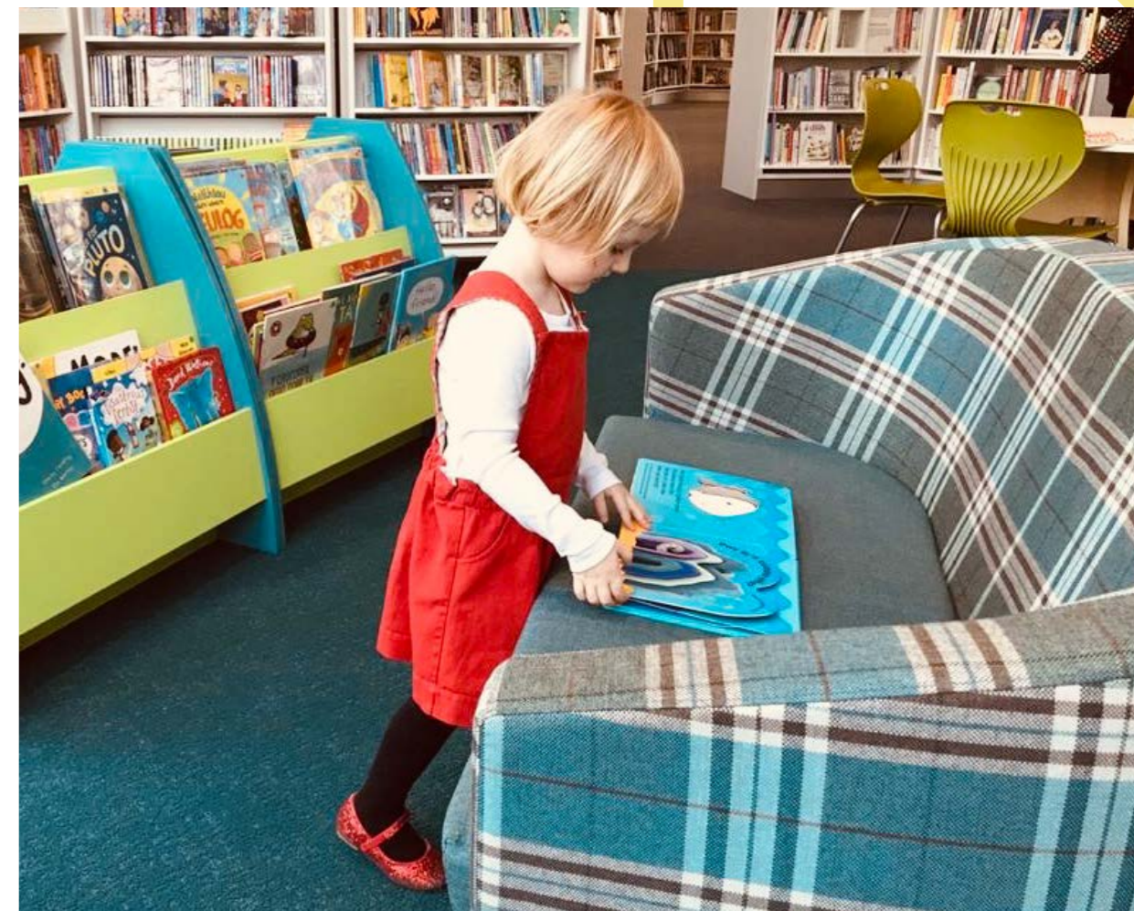
Llyfrgell Ardal yng Nghanolfan Ddiwylliant Conwy

Mae llyfrgelloedd hefyd yn llefydd diogel lle caiff pobl fynediad at wasanaethau sylfaenol yn ddidrafferth ac sy'n rhaff achub i'r rhai hynny sy'n ynysig neu wedi'u cau allan o fywyd cymunedol. Mae'r cyfuniad o ddiwylliant yn y llyfrgell – llenyddiaeth, ffilm a'r cyfryngau digidol, treftadaeth a'r celfyddydau – yn cynnig porth gwych at ddiwylliant i'r rhai hynny nad ydynt fel arfer yn cael cyfle i gymryd rhan.