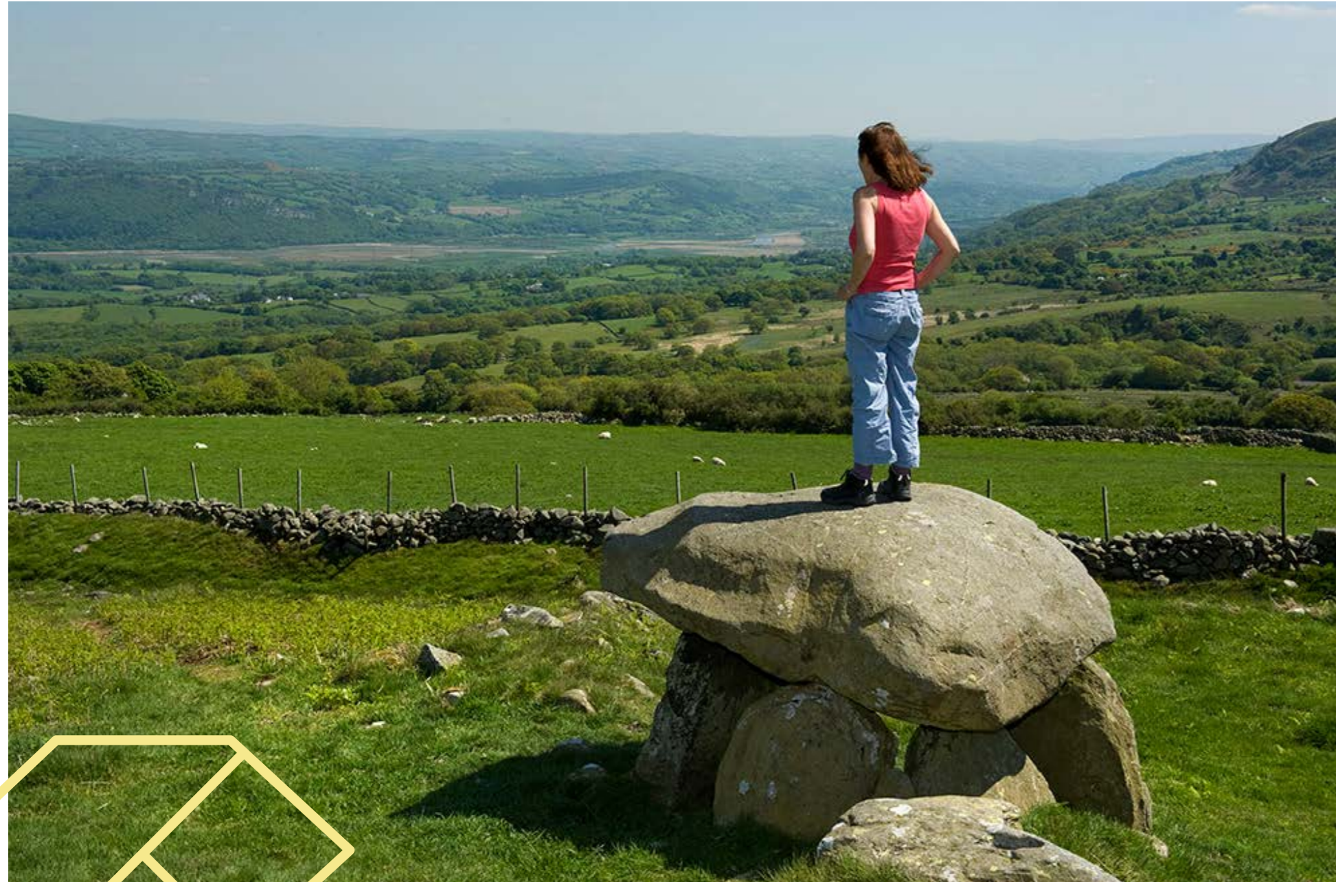
Siambr Gladdu Maen y Bardd, Rowen