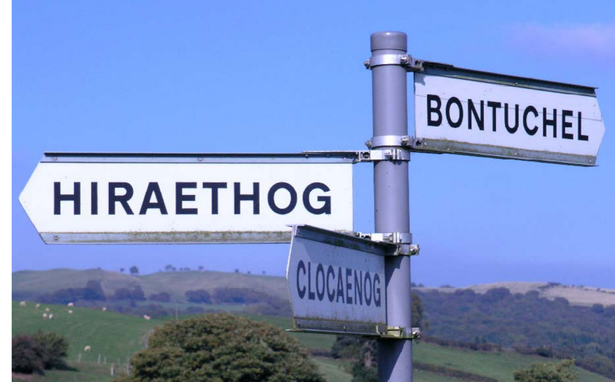
Tua Hiraethog, Conwy Wledig

"Mae hwn yn gynllun ardderchog sy'n caniatáu i ni gael sioeau a fyddent fel arall y tu hwnt i'n cyrraedd. Does gennym ni ddim amwynderau yng Nghwm Penmachno a heb y sioeau hyn byddai ein cymuned yn dlotach yn ddiwylliannol ac yn gymdeithasol" (Grŵp Gweithredu Cymunedol Cwm).