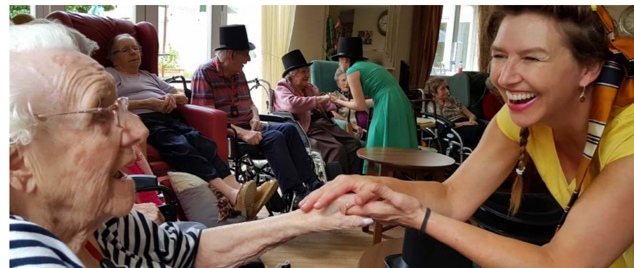
Taith Dancing the Decades i Gartrefi Gofal Cymru