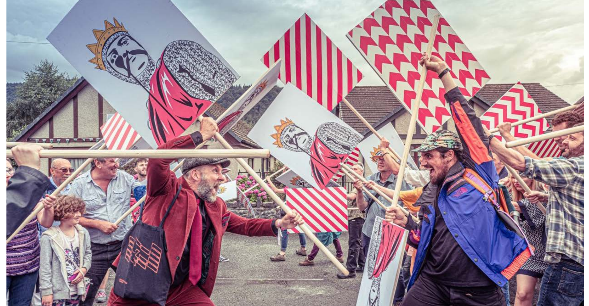
Ôl Llywelyn, Llanrwst.

Gall cyflwyno elfennau diwylliannol gryfhau ac adfywio'n sylweddol ddiwyddiadau sydd eisoes yn bodoli. Mae gennym eisoes galendr rhagorol o ddiwyddiadau yng Nghonwy ac rydym eisiau ychwanegu ato a'i wella drwy greu rhaglen ddiwylliannol gryf gyda'n cymuned a'n sector creadigol. Ble bynnag bosib byddwn yn defnyddio ein safleoedd diwylliannol a'n tirluniau eiconig fel llwyfan. Mae marchnata effeithiol yn hanfodol bwysig i raglennu llwyddiannus, a byddwn yn sicrhau bod digwyddiadau a gwyliau sydd eisoes yn bodoli'n cael eu cysylltu a'u hyrwyddo dan faner diwylliant wedi'i rhannu.