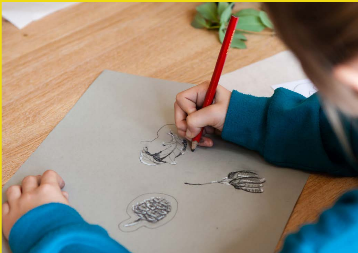
Criw Celf Conwy

Byddwn hefyd yn adeiladu ar gynlluniau fel Rhaglen Llysgenhadon Treftadaeth Ifanc Canolfan Ddiwylliant Conwy ac yn ceisio ehangu'r cyfleoedd am ddysgu achrededig.