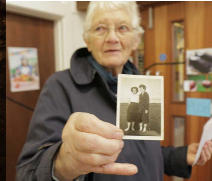
Enid ac Irene, Straeon Ysgol Bodlondeb

Mae gan Gonwy gymuned eang o bobl sy'n angerddol am ddiwylliant y sir. Mae pobl a sefydliadau ar draws y rhanbarth wedi dweud wrthym y bydd sector diwylliannol mwy cysylltiedig yn cael mwy o effaith. Drwy gefnogi partneriaethau diwylliannol a chynllunio mwy cydlynol gallwn gryfhau cynnig diwylliannol y sir yn aruthrol.