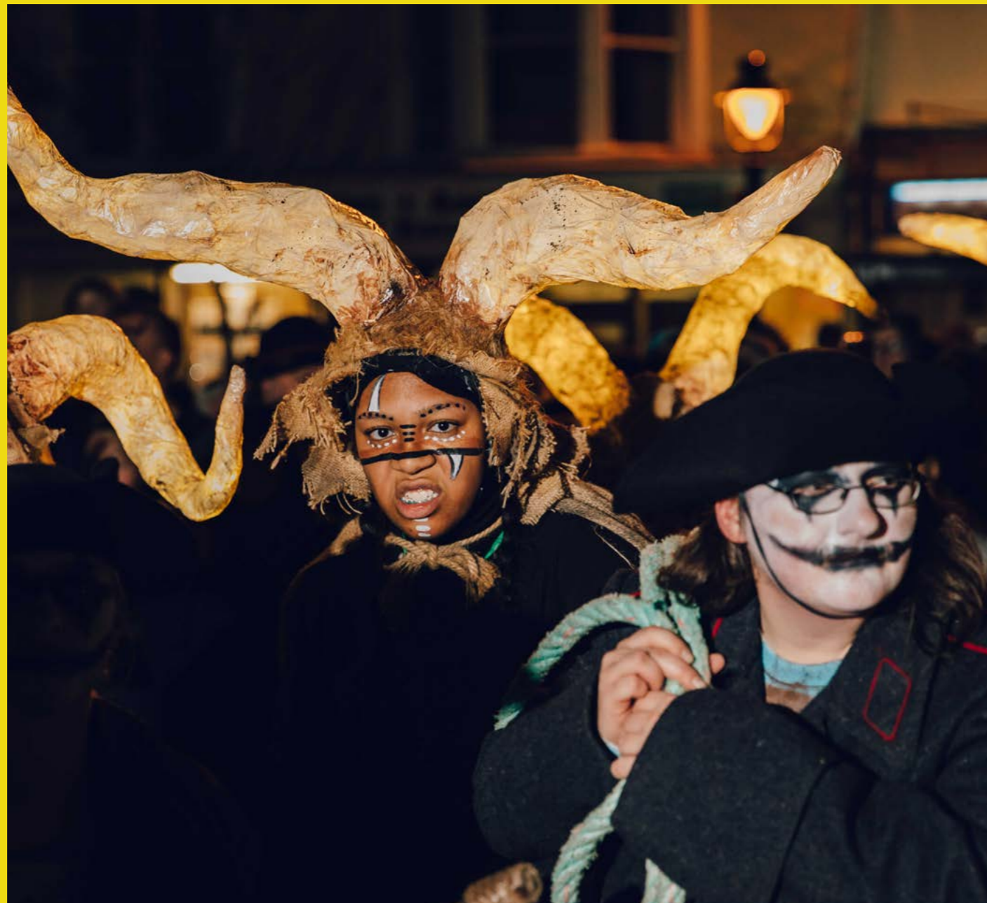
Golau Gaeaf

I lwyddo, mae'n rhaid i Greu Conwy sicrhau bod pobl ifanc, gweithwyr llawrydd creadigol a grwpiau sydd yn draddodiadol wedi'u hymyleiddio'n cael eu cynrychioli mewn unrhyw fodel llywodraethu a bod y broses o wneud penderfyniadau'n cael ei throsglwyddo os yw hynny'n briodol. Felly hefyd wrth weithio gyda'r genhedlaeth nesaf o bobl ifanc greadigol, mae'n rhaid i Greu Conwy gofleidio ymdriniaethau heb fod yn draddodiadol a bod yn barod i roi rheolaeth guradurol i bobl ifanc.