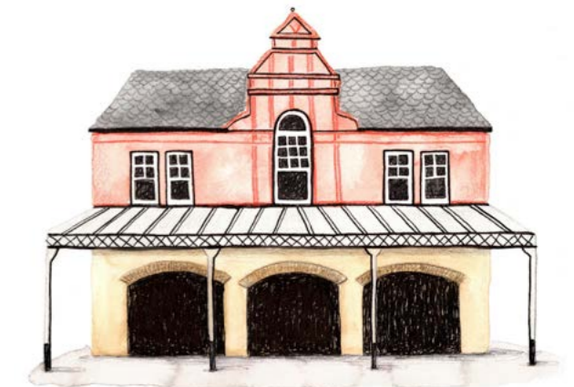
Theatr Colwyn

Mae potensial i ehangu gwaith rhaglennu i weithio gydag amrywiaeth ehangach fyth o sefydliadau gan gefnogi lleoliadau a mentrau annibynnol, llai. Yn y tymor hirach gallai hyn arwain at ŵyl theatr newydd, o bosibl gan ddefnyddio lleoliadau awyr agored yn ystod yr haf.