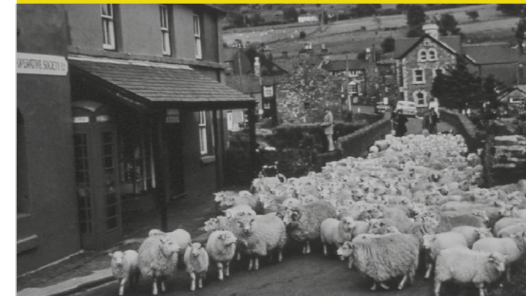
Bugeilio ym Mhenmachno. Delwedd heb ddyddiad

Cynllun Rheoli Cyrchfan Conwy: Cryfhau enw da cenedlaethol a rhyngwladol Conwy fel canolbwynt diwylliannol; creu rhaglenni mwy cydlynol ac anturus; trawsnewid twristiaeth, yn enwedig y tu hwnt i'r prif dymor; defnyddio lleoliadau eiconig a natur ar gyfer digwyddiadau diwylliannol a'r celfyddydau.