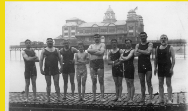
Dynion yn ymdrochi ger Pafiliwn y Pier, Bae Colwyn

Er mai'r trefi Sbardun sydd yn y sbotolau, ohonynt bydd prosiectau a manteision yn estyn allan i ardaloedd eraill yn cynnwys Bae Cinmel, Cyffordd Llandudno, Penmaenmawr, Llanfairfechan, Betws y Coed a'n cymunedau gwledig.