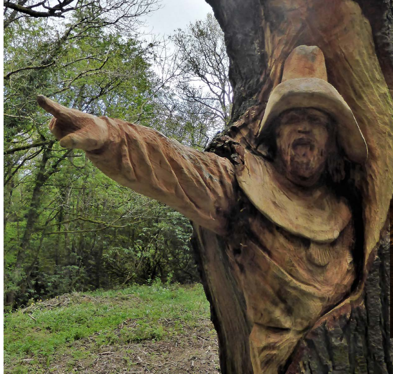
Hafodunos, Llangernyw, ar Lwybr y Pererin o Abaty Dinas Basing i Ynys Enlli