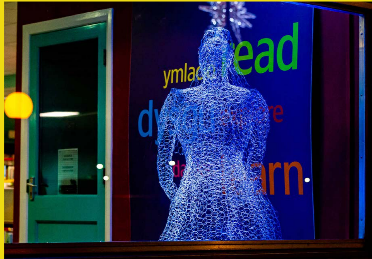
Llwybr Celf Abergele

Bydd y bartneriaeth strategol newydd yn cynnal cysylltiadau agos â'r trydydd sector ac yn sicrhau eu bod yn cael eu cynrychioli.