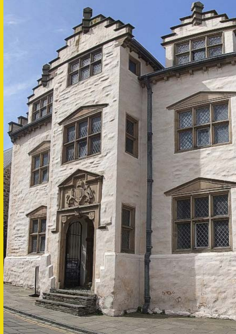
Plas Mawr, Conwy

Fel llyfrgelloedd, mae amgueddfeydd a galerïau'n ysbrydoli pobl ac yn cynhyrchu syniadau, yn meithrin sgiliau a dysgu ac yn dod â chymunedau at ei gilydd. Mae llwyddiant Creu Conwy a phob Sbardun yn dibynnu ar gryfhau rhwydweithiau rhwng y lleoliadau hyn a gwneud yn siŵr bod marchnata, rhaglennu a hyfforddiant cydlynol yn darparu cefnogaeth ble bo'i hangen.