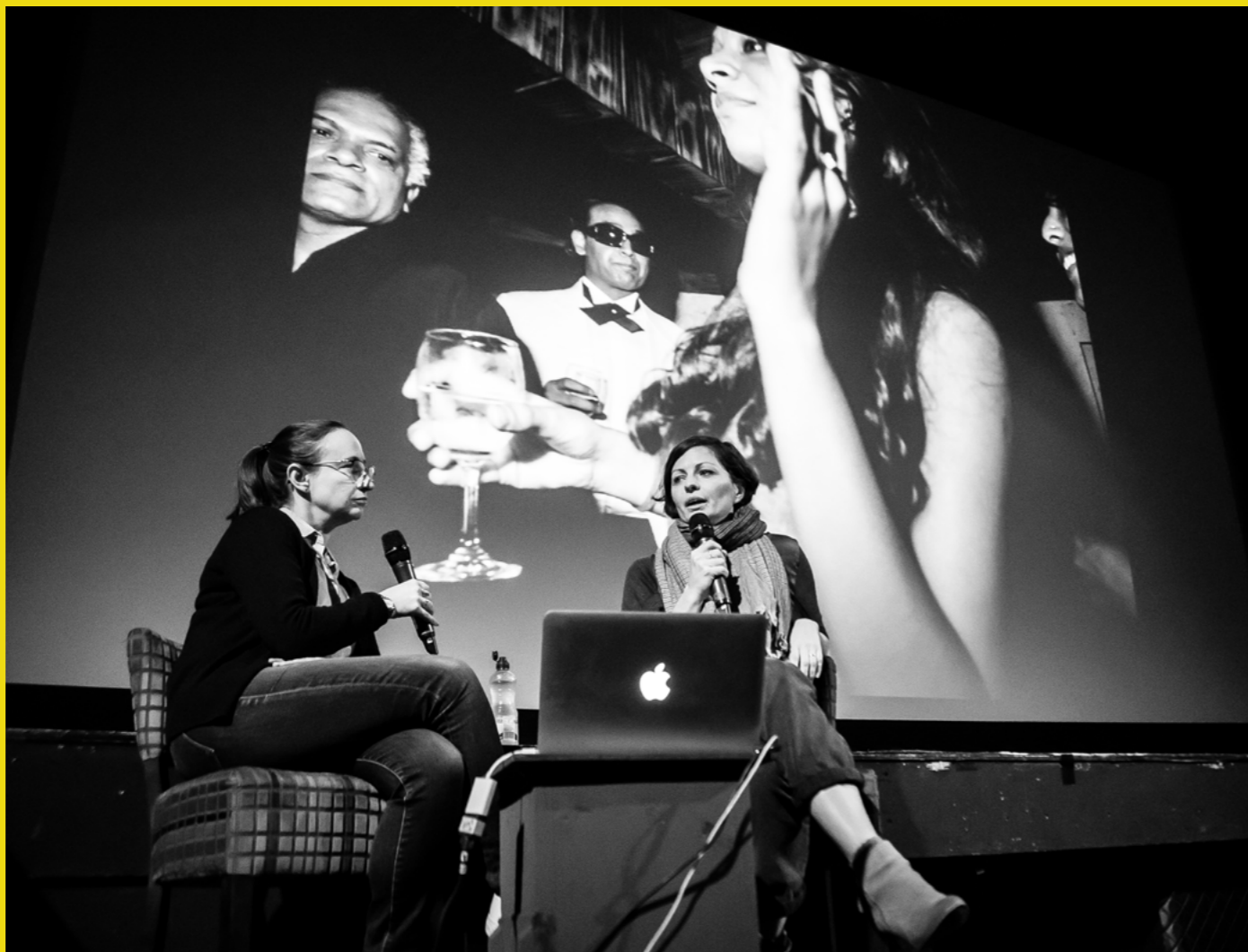
Gŵyl Ffotograffiaeth Northern Eye

Mae'r Llwybr Dychymyg yn rhan o brosiect Dychmygu Bae Colwyn , cynllun Llefydd Gwych y Loteri Genedlaethol.