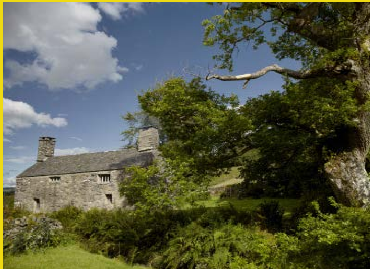
Tŷ Mawr Wybrnant

Gall y defnydd o'r Gymraeg roi ymdeimlad o fod yn goeliadwy a chreu cysylltiadau ystyrion. Byddwn yn archwilio dulliau o gyflwyno'r Gymraeg mewn ffyrdd chwareus ac ysgafn, gan helpu i annog y defnydd o eiriau Cymraeg sylfaenol. Gellid gwneud hyn drwy apiau a phlatfformau digidol eraill, digwyddiadau, arwyddion dros dro chwareus, arddangosfeydd a cherddoriaeth, gan weithio mewn partneriaeth â sefydliadau megis Menter Iaith.