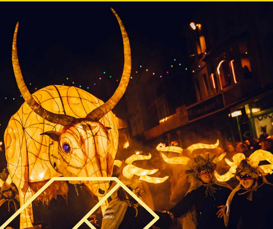
Golau Gaeaf