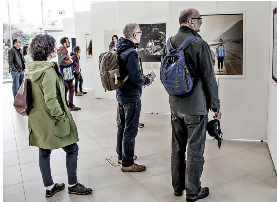
Gŵyl Ffotograffiaeth Northern Eye