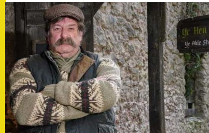
Cledwyn, I'm a Celebrity...Get Me Out of Here!

Lansiwyd ap Llwybr Dychmyg Bae Colwyn ym mis Medi 2021. Mae'r ap yn seiliedig ar lwybrau treftadaeth lleol gyda chynnwys creadigol a hanesyddol wedi'i gyfoethogi â phrofiadau realiti estynedig ger adeiladau a thirnodau cyfarwydd. Mae'r llwybr wedi gwneud treftadaeth leol yn fwy deniadol i grŵp ehangach o bobl drwy wneud y cyffredin yn antur. Mae'r Llwybr Dychmyg yn rhan o brosiect Dychmygu Bae Colwyn, cynllun Lle Arbennig Cronfa Dreftadaeth y Loteri.