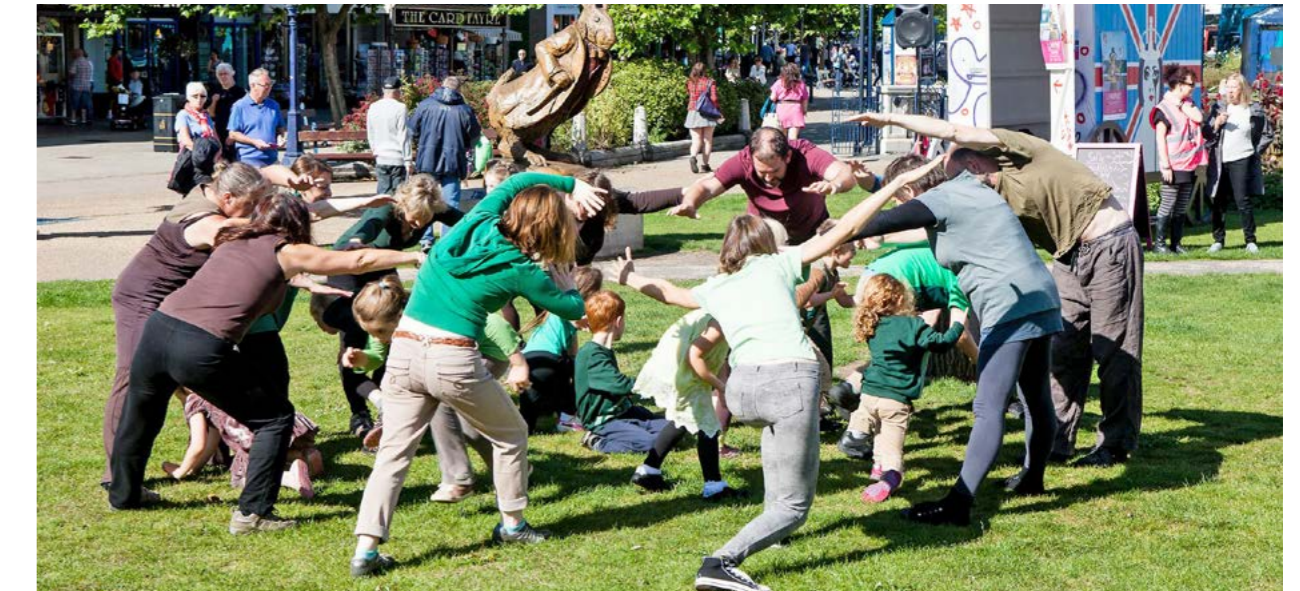
Dawns Teulu, LLAWN

Mae'n darparu grantiau i weithredwyr diwylliannol annibynnol ac yn cyflogi staff sy'n gweithio'n agos â sefydliadau diwylliannol ac yn darparu digwyddiadau. Mae hyn oll yn golygu fod y Cyngor mewn sefyllfa dda o ran maint ac adnoddau i gefnogi twf sector diwylliannol y sir. Fodd bynnag, fel y rhan fwyaf o awdurdodau lleol, mae'r cyfrifoldeb am ddiwylliant wedi'i ledaenu ar draws nifer o wasanaethau ac yn allanol drwy gyrff fel Cadw, yr Ymddiriedolaeth Genedlaethol, MOSTYN ac Awdurdod Parc Cenedlaethol Eryri.