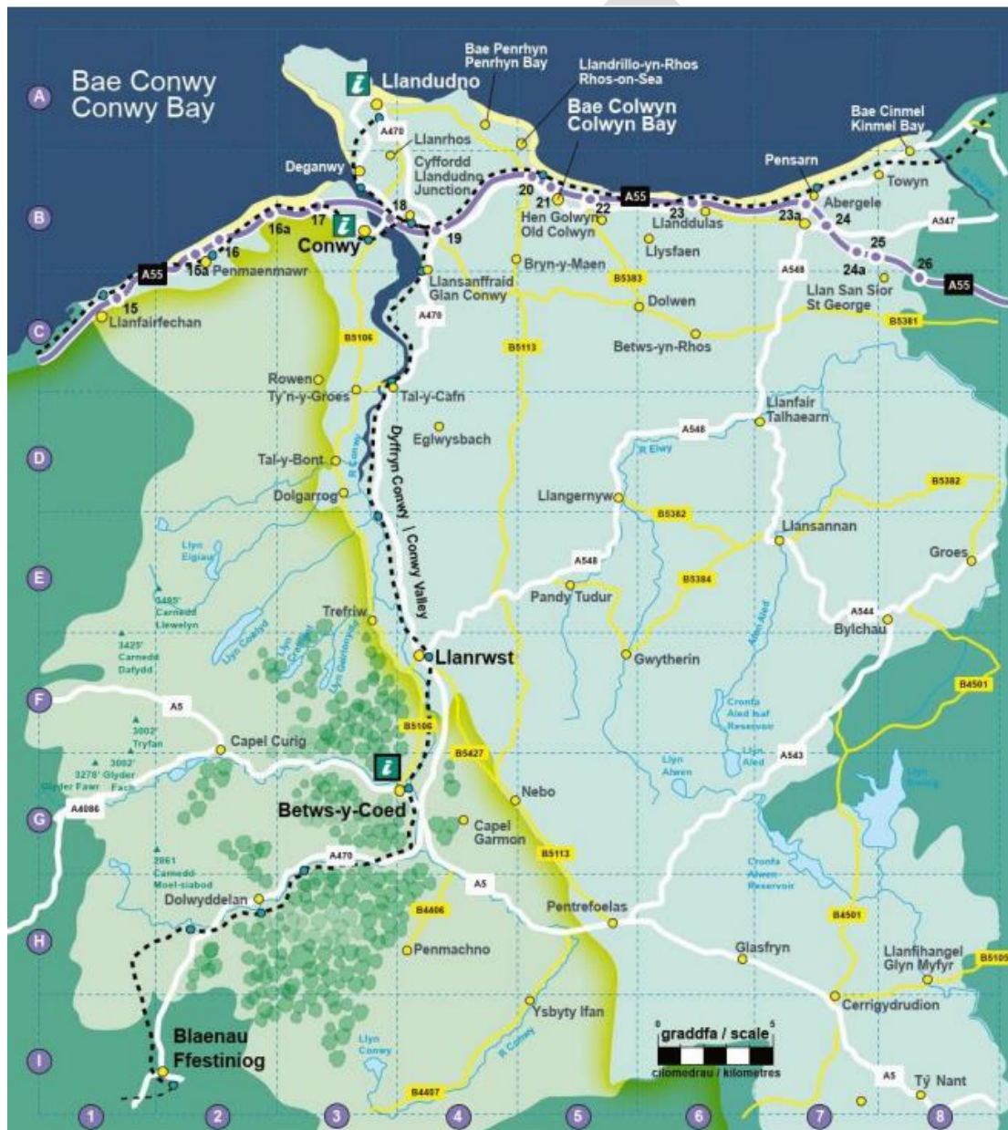
Delwedd: Map o Sir Conwy

Mae Bwrdeistref Sirol Conwy wedi'i leoli'n ganolog yng Ngogledd Cymru. Mae gan y Fwrdeistref Sirol arwynebedd o 113,000 hectar a phoblogaeth o 114,800 o drigolion (Cyfrifiad 2021). Mae 38% o'r arwynebedd a 4% o'r boblogaeth o fewn Parc Cenedlaethol Eryri.