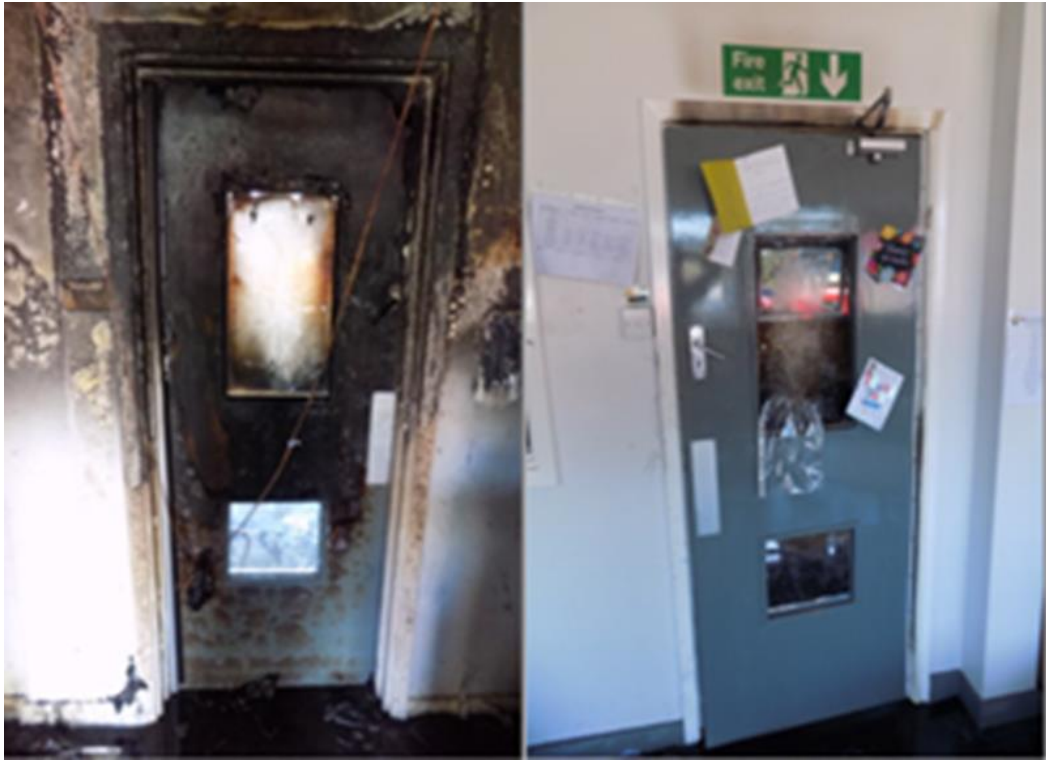
Drws tân llwyddiannus

Dros y blynyddoedd, mae ef wedi gweld sawl un nad yw'n ateb y gofyn mwch, neu ddim yn cwrdd â'r safon nod barcut. Dyma un o luniau Alastair, ac mae'n dangos dwy ochr drws tân, sy'n bodloni'r safon, yn dilyn tân.