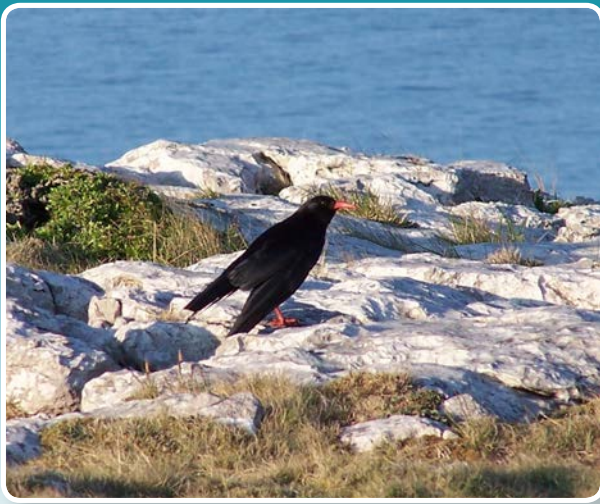
↑ Brân goesgoc, aelod prin o deulu'r frân a geir yn aml mewn ardaloedd creigiog anghysbell.

Mae tinwen y garn, sy'n cyrraedd o Ogledd Affrica yn y gwanwyn yn nythu ymysg y creigiau a'r waliau ac yn bwydo ar bryfaid yn y glaswelltir byr. Gellir gweld llinosiaid ac ehedyddion yn y glaswelltir calchfaen, ac mae'r clochdar y cerrig ac ehedydd y traeth yn dod o hyd i loches ar gyfer nythu yn y rhostir. Mae preswylwyr eraill yn cynnwys y gigfran, brân goesgoc, tylluan bach a'r hebog tramor sy'n preswylu yn y clogwyni mwy anghysbell.