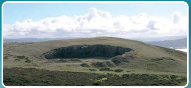
↑ Edrych tua Chwarel yr Esgob o ben y gwylfryn.

Mae dylanwad y Llychlynwyr hefyd yn amlwg ar y Gogarth. Mae hyn yn arbennig o wir am y gair "Orme" (sef y gair Saesneg am y Gogarth) gan y credir i'r gair ddod o'r hen eiriau Norwyaidd 'horma heva' sy'n golygu 'draig' neu 'anghenfi l y môr'. Hefyd, mae arian a ddarganfuwyd yn ymyl Eglwys Tudno Sant, a oedd yn cynnwys arian King Cnut (Brenin y Llychlynwyr) yn cadarnhau'r cysylltiad hwn.