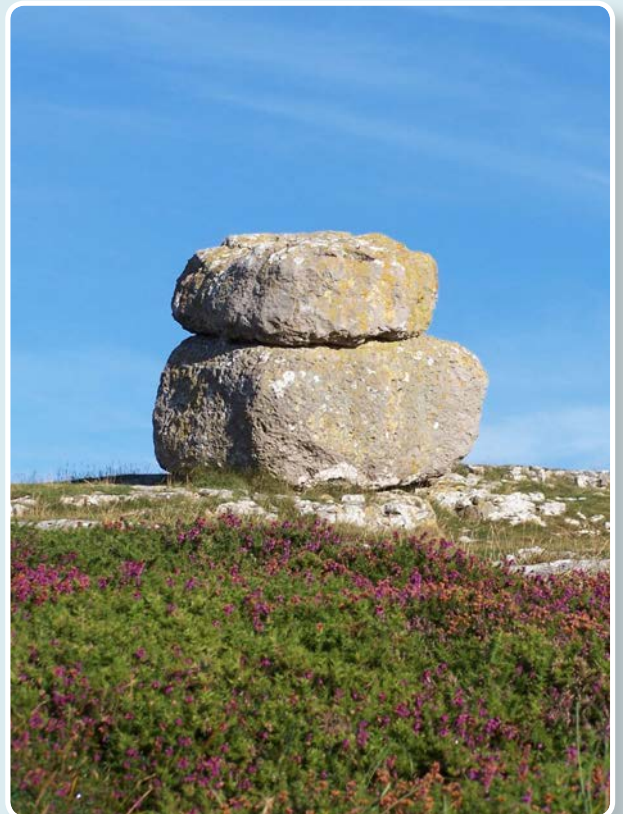
↑ Maen crwydr rhewlifol.

Mae'r clogfeini neu'r meini dyfod sydd wedi'u gadael ledled y penrhyn yn dystiolaeth o rewlifoedd yn toddi.