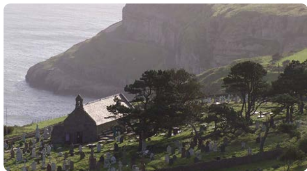
↑ Eglwys Tudno Sant.

Hefyd ar y Gogarth, mae 'Ogof Tudno' oedd yn cynnwys llawer o lygaid meheryn a chregyn gleision tebyg i'r rhai a ganfuwyd yn yr ogofau a feddiannwyd, ond nid oes dyddiad pendant i'r rhain. Cyrhaeddodd pobl Neolithig yr Oesoedd Cerrig diweddarach yn ne Lloegr rhwng tua 4,000 CC a 2,500 CC, gan gyflwyno arferion ffermio a chrochenwaith. Datblygont ffatri fwyelli ym Mhenmaenmawr gan sefydlu llawer o aneddiadau hefyd. Roedd pobl Neolithig yn claddu eu meirw mewn siambrau claddu trawiadol. Gwelir enghraifft o siambr neu 'gromlech' ar y Gogarth, mewn cae islaw'r orsaf dramia hanner ffordd.