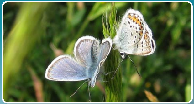
↑ Nid yw'r glöyn byw glesyn serenog prin hwn i'w gael yn unman heblaw'r Gogarth.

Nid yw glöynnod byw yn hedfanwyr cryf ac maent yn dueddol o fod yn fwyaf gweithgar mewn lleoedd cysgodol neu yn ystod tywydd gostegol a heulog. Mae gwyfynod fel arfer yn hedfan yn ystod y cyfnos a drwy'r nos a gellir eu gweld lle bynnag fo goleuadau.