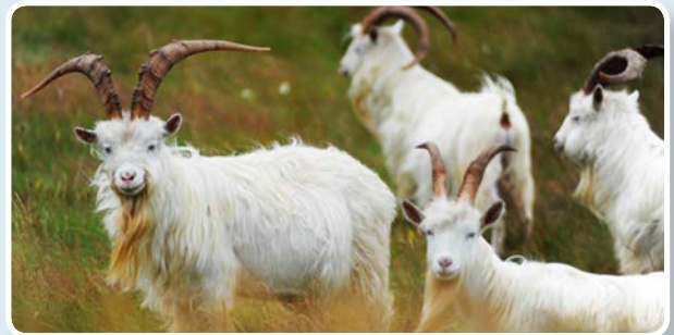
↑ Geifr y Gogarth

Mae cyfanswm o 24 math o löyn byw wedi'i gofnodi ar y Gogarth.