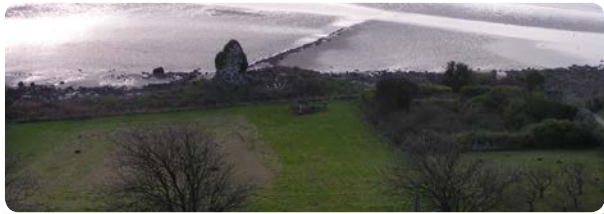
↑ Adfeilion yw'r cyfan sydd ar ôl o Balas yr Esgob.

Gadawodd y Rhufeiniaid Brydain tua 410 AD, ac am sawl cenhedlaeth, mae'r cofnodion hanesyddol yn brin iawn.