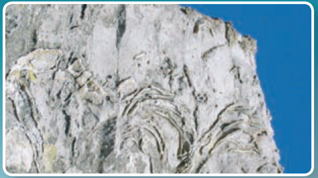
↑ Ffossilau'r Gogarth.