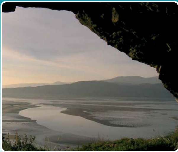
↑ Golygfa o ogof ar y Gogarth.