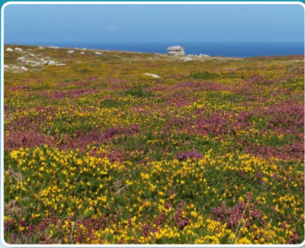
↑ Rhostir Calchfaen.