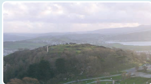
↑ Pen Dinas.

Heblaw am fwyngloddio, roedd pobl yr Oes Efydd yn ffermio, yn hela ac yn pysgota. Gellir gweld tystiolaeth o'r cytiau crwn lle roeddent yn byw ar y Gogarth hyd heddiw.