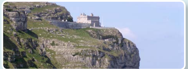
↑ Y Goleudy.

Roedd dwy chwarel gerrig yn bodoli ar y Gogarth yn y gorffennol sef Chwarel Rofft a Chwarel yr Esgob. Dywedwyd bod cerrig o'r Chwarel Esgob wedi'u defnyddio i adeiladu Cob Conwy a Phont Grog Telford yng Nghonwy ym 1826. Cariwyd y cerrig ar y môr o amgylch y Gogarth drwy fae bas sy'n ffurfio rhan o Ogorf Colomennod a elwir yn Porth yr Helyg.