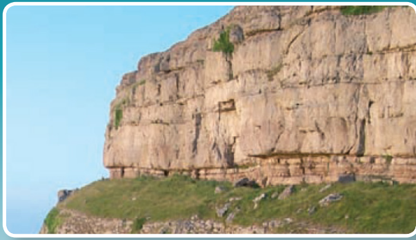
↑ Bwtres Sant Tudno yn dangos yr haenau o galchfaen ar y penrhyn.