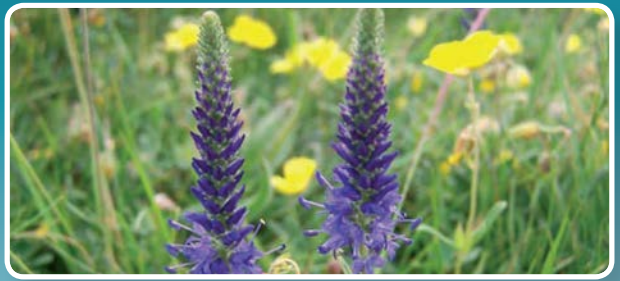
↑ Rhwyddlwyn pigfain, planhigyn a geir mewn glaswelltir calchfaen sy'n brin iawn yn genedlaethol.

Mae'r palmentydd calchfaen yn cynnwys planhigion diddorol iawn oherwydd bod y greiciau (sianeli dwfn) yn darparu cysgod a lleithder mewn man sych ac agored iawn. Mae hyn yn gadael i blanhigion sy'n hoffi cysgod a ddarganfyddir gan amlaf mewn coetiroedd fel bresych y cŵn a sawl amrywiaeth o redyn, gan gynnwys duegredynen y muriau a'r duegredynen goesddu i dyfu. Mae rhannau moel y galchfaen yn cael eu gorchuddio'n aml gan gennau a mwsogl, ac mae'r glaswelltir o amgylch yn llawn cor-rosyn lledlwyd.