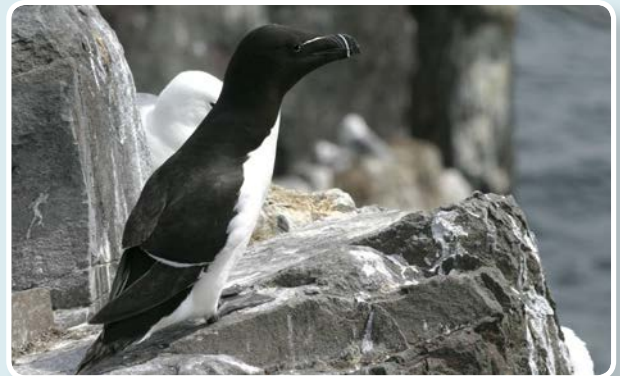
↑ Gweilch y penwaig.

Mae planhigion anffrodorol (planhigion sydd wedi'u cyflwyno) yn fygythiad mawr i'n bywyd gwyllt brodorol, yn ail i golli cynefi noedd.