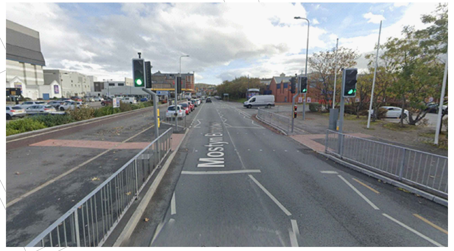
Enghraifft o groesfan i gael ei ddarparu