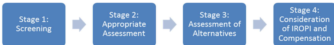
Ffigur 2.1: Proses yr ARhC