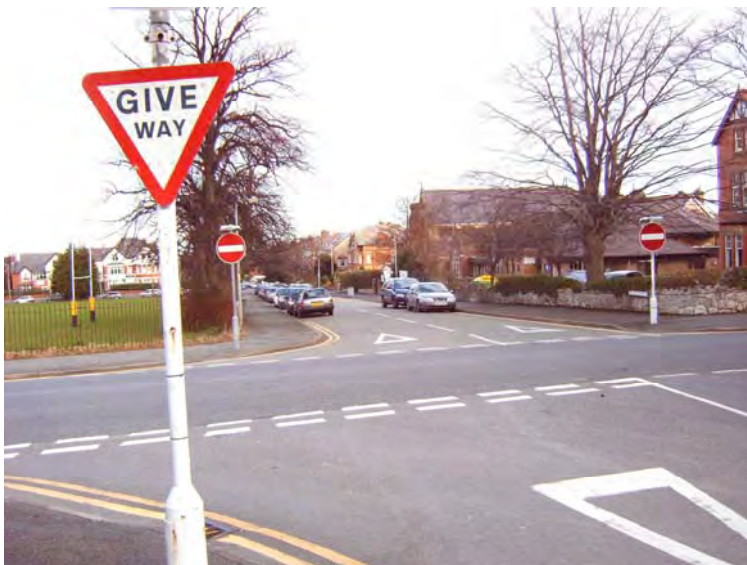
Dodrefn stryd a marciau ffordd

Gall marciau stryd gormodol hefyd gael effaith negyddol ar lawer o barth y cyhoedd.