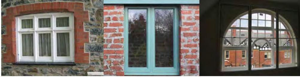
Gwahanol fathau o ffenestri treftadaeth