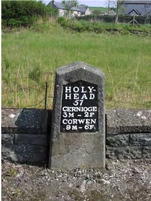
Arwydd carreg filltir hanesyddol

Dylai'r iaith Gymraeg gael ei defnyddio ar blaciau enwau strydoedd ac arwyddion teithiol lle bo'n briodol, gweler y canllawiau ychwanegol yn TAN 20 a CDLI06: CCA Yr Iaith Gymraeg.