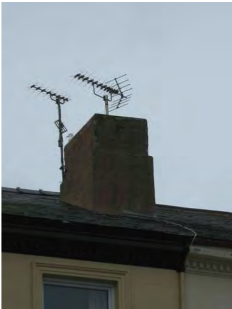
Erialau wedi'u gosod ar simneiau