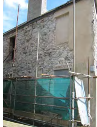
Gwaith adnewyddu ar waliau allanol