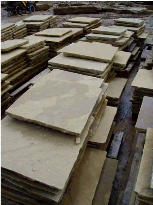
Teils palmant newydd

Dylai fod rhagdybiaeth o blaid atgyweirio a dyblygu deunyddiau palmant hanesyddol ym mharth y cyhoedd. Wrth i gyfleoedd godi dylai fod rhagdybiaeth i adennill neu ailadrodd deunyddiau hanesyddol sydd wedi eu colli mewn manau a strydoedd cyhoeddus allweddol. Mae hyn yn berthnasol i'r rhan fwyaf o Ardaloedd Cadwraeth, er y byddai palet cyfoes ond cyfyngedig o ddeunyddiau yn briodol mewn ardaloedd newydd nad oes ganddynt gynseiliau hanesyddol. Mae'n rhaid i ddeunyddiau cyfoes fod yn wahanol i, ond eto ategu at, y palet deunyddiau hanesyddol.