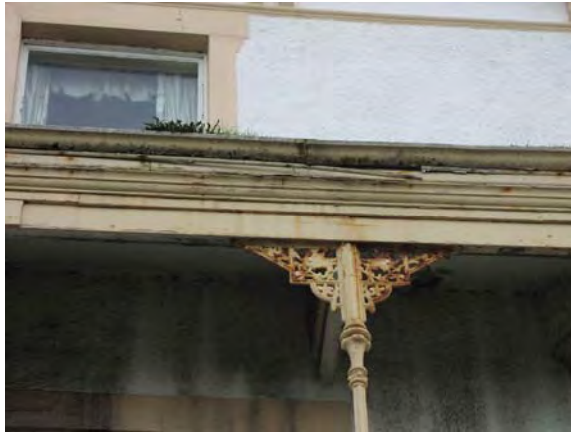
Gwaith haearn allanol sy'n gofyn am waith cynnal a chadw