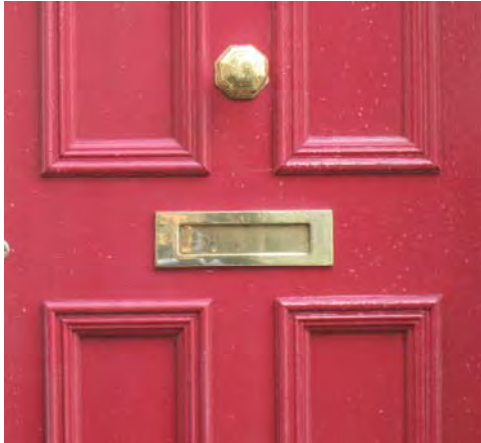
Drws ffrynt treftadaeth