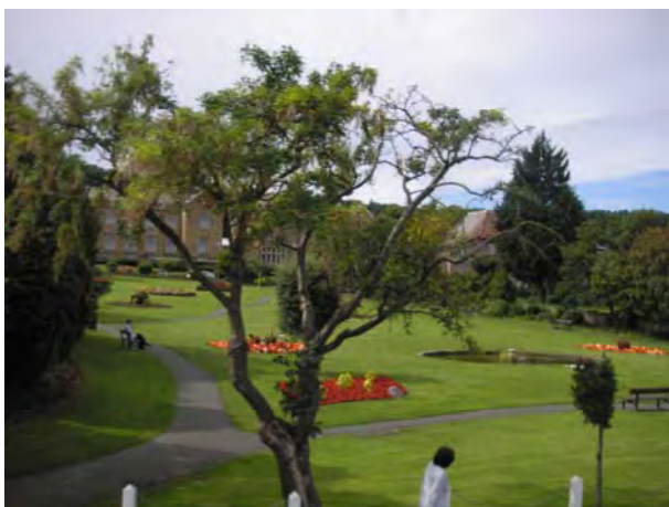
Gofod agored cyhoeddus