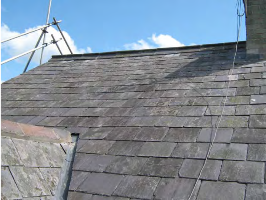
Enghraifft o do llechi wedi'i adnewyddu

a gosod a thrwsio erialau teledu er mwyn lleihau difrod a dylid cynnal archwiliadau proffesiynol bob 5 mlynedd. Dylai traddodiadau a dulliau adeiladu lleol gael eu dilyn gan döwr medrus wrth wneud gwaith trwsio. Dylid cadw llechi/ teils gwreiddiol a'u hail-ddefnyddio lle bynnag y bo modd yn yr ardaloedd amlycaf. Gellir defnyddio llechi/ teils clai newydd ar gyfer ardaloedd llai amlwg o'r to. Dylid ond ystyried ail-doi'r to cyfan pan fo'r deunydd toi wedi dod i ddiwedd eu hoes neu nad yw atgyweiriadau bellach yn gost-effeithiol. Fel arfer, dylai ffenestri to fod yn rhai proffil isel o fath Gradd Cadwraeth mewn Ardaloedd Cadwraeth.