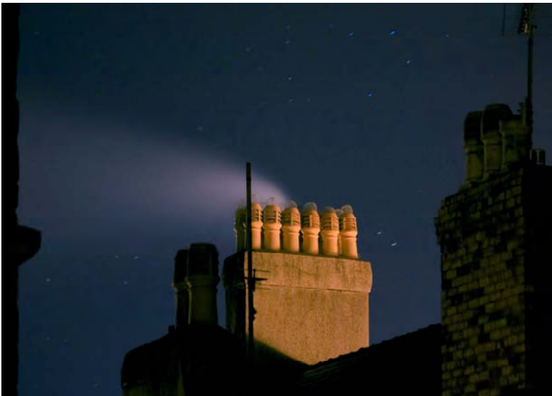
Simneiau yn ychwanegu cymeriad i edrychiad ardal gadwraeth

Byddai newidiadau i do'r adeiladau yn gyffredinol angen caniatâd cynllunio. Gall simneiau fod o amrywiaeth o siapiau, meintiau ac arddulliau addurnol. Mae eu lleoliad amlwg yn cyfrannu'n sylweddol at ymddangosiad cyffredinol a chymeriad Ardal Gadwraeth. Mae'n hanfodol bod rhaglen arolygu reolaidd yn cael ei chynnal. Heddiw, mae llawer o simneiau yn ddiangen, ond heb gael eu cynnal a chadw'n rheolaidd gallant wanhau ac efallai gallai dŵr dreiddio iddynt heb yn wybod. Mae'n rhaid i waith atgyweirio a chynnal a chadw gyd-fynd â'r cynnau simnai gwreiddiol mewn lliw, gwead, mandylledd a dyluniad.