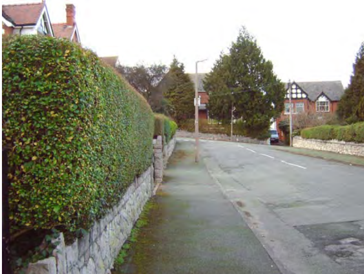
Triniaethau ffiniau - cloddiau a waliau castello g calchfaen

Mae gerddi ffrynt preifat, waliau terfyn sy'n eu hamgáu a'u tirlunio yn elfennau pwysig yn y strydlun a dylid eu cadw, lle bynnag y bo'n bosibl. Nid yw blaengyrtiau parcio fel arfer yn dderbyniol mewn Ardaloedd Cadwraeth.