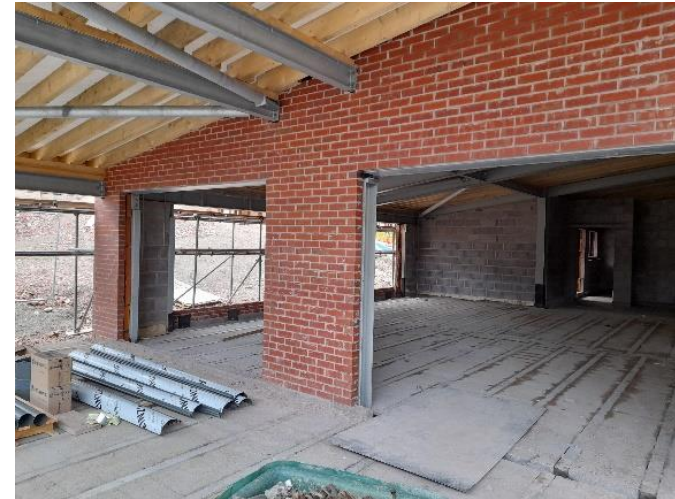
Bryn Euryn internals