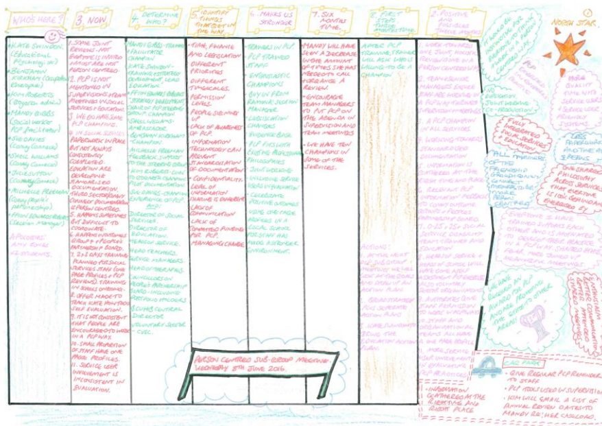
(Ffotograff LLWYBR Grŵp Llywio CCU: hwyluswyd a chofnodwyd trwy garedigrwydd Cyswllt Conwy, Mehefin 2016).

Lluniwyd y deilliannau a'r gweithredoedd canlynol gan y grŵp llywio yn defnyddio fersiwn sefydliadol sy'n canolbwyntio ar yr unigolyn o'r adnodd cynllunio 'LLWYBR'. Maent yn anelu i'n symud yn agosach at weledigaeth y strategaeth a ddisgrifir uchod. Anelwn i gwblhau'r gweithredoedd erbyn Gorffennaf 2017 neu ynghynt.