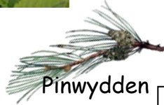
Pinwydden yr Alban