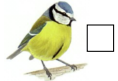
Titw tomos las