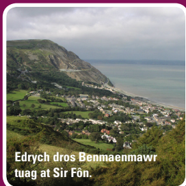
Edrych dros Benmaenmawr tuag at Sir Fôn.