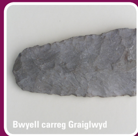
Bwyell carreg Graiglwyd