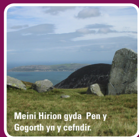
Meini Hirion gyda Pen y Gogorth yn y cefndir.

I fyny ac i'r chwith mae Graiglwyd. Roedd galw mawr am fwyell cerrig gan mai dyma oes y ffermwyr cyntaf a oedd yn clirio'r tir i blannu cnydau. I wneud hyn roeddynt angen y fwyell carreg. Byddai dynion yn cerfio'r bwyelli allan o blociau o garreg oedd newydd cael ei chwarelu. Dyma "Ffatri Bwyell Cerrig!".