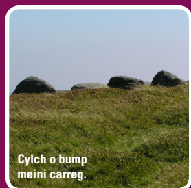
Cylch o bump meini carreg.