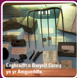
Enghraifft o Bwyell Cerrig yn yr Amgueddfa.