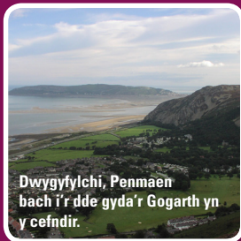
Dwygyfylchi, Penmaen bach i'r dde gyda'r Gogarth yn y cefndir.