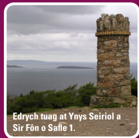
Edrych tuag at Ynys Seiriol a Sir Fôn o Safle 1.