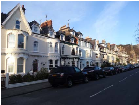
Chapel Street Terrace

Mae Egwyddor Adeiladau heb eu rhestru yn cynnwys ond heb fod yn gyfyngedig i'r canlynol