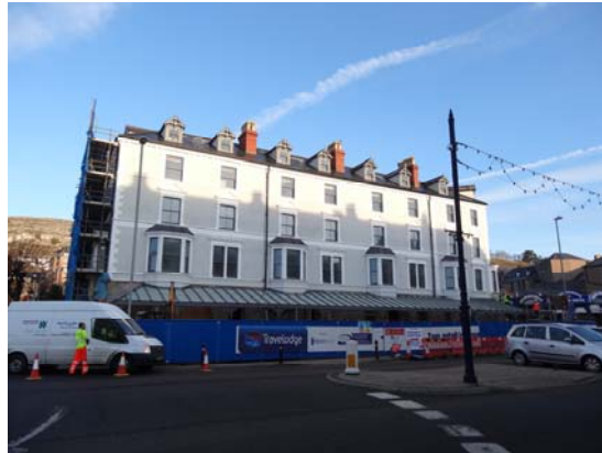
The Clarence Hotel

4.21 Mae sawl adeilad rhestredig yn yr ardal gadwraeth, ac mae'r rhain wedi'u cynnwys yn Atodiad 2).